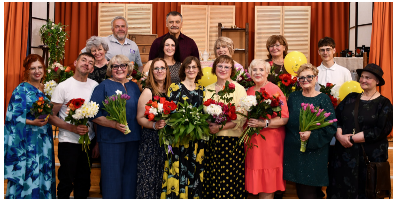
Rudzātu teātra kopa „Okūts” atzīmē 20 gadu jubileju.

Milzīgs un sirsnīgs paldies jubilejas pasākuma sponsoriem un atbalstītājiem: SIA „Zelta zeme”, SIA