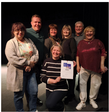
Līvānu novada Kultūras centra amatiereteātris Latvijas amatiereteātru iestudējumu skates „Gada izrāde 2025” finālā Jūrmalā

Latvijas amatiereteātru iestudējumu skates mērķis ir nodrošināt amatiereteātru tradīcijas saglabāšanu un nepārtrauktību Latvijā un latviešu diasporā, popularizēt ama-