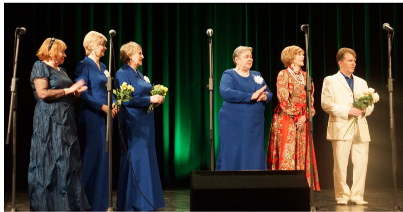
Ansamblis „Razdolje” svin piecu gadu jubileju