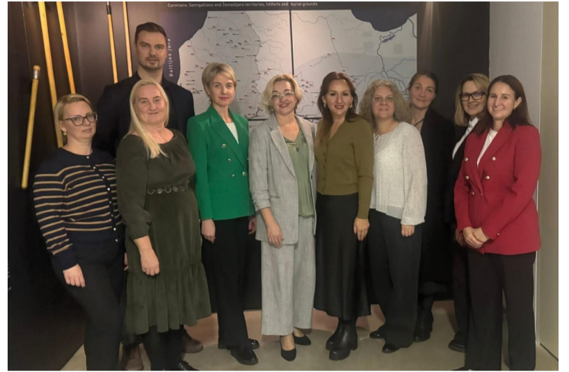
Līvānu novada pašvaldības speciālisti tiekas ar Lietuvas partneriem

Projekta ietvaros tiks izstrādāts inovatīvs risinājums – mobilais klientu apkalpošanas centrs, kas dos iespēju sniegt dažādus pašvaldības un sociālos pakalpojumus tieši iedzīvotāju mājās. Šis pilnvērtīgi aprīkots elektrobusa veida centrs būs īpaši noderīgs senioriem, cilvēkiem ar īpašām vajadzībām un tiem, kuriem ir grūtības nokļūt līdz pakal-