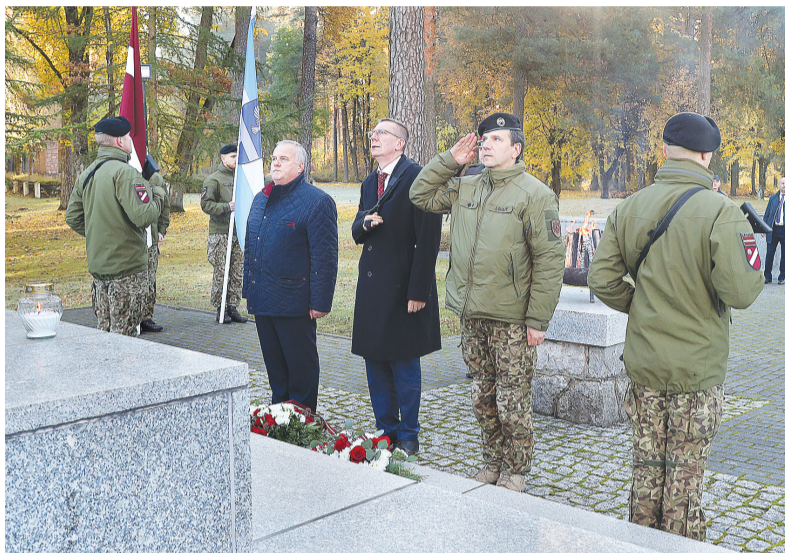
Valsts prezidents noliekot ziedus pie Līvānu Atbrīvošanas pieminekļa

„Līvāni godpilni nes Jauniešu galvaspilsētas titulu 2024. gadā. Tas ir augsts novērtējums gan novada jauniešu līderībai un attieksmei, gan pašvaldības rūpēm un piešķirtajiem