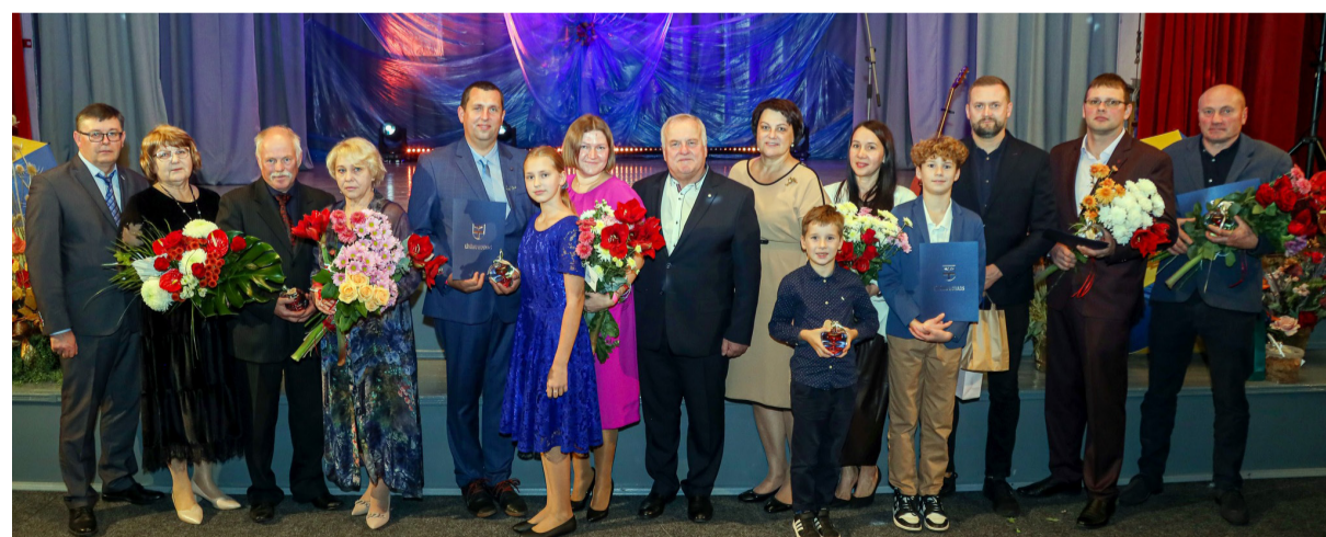
Līvānu novada uzņēmēju, lauksaimnieku un amatnieku gada balvas ieguvēji