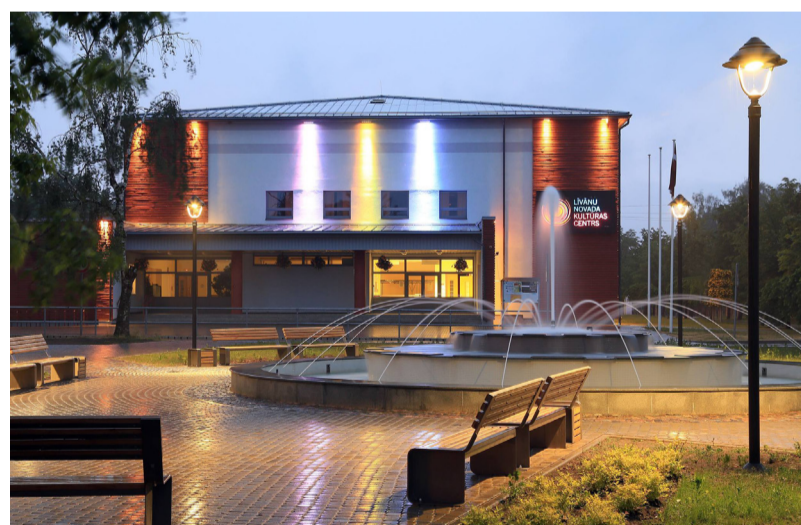
Līvānu novada Kultūras centrs šodien

da dome un pašvaldības speciālisti neatlaidīgi meklēja iespējas ēkas atjaunošanu turpināt, un 2008. gada oktobrī tika iesniegts projekts un rekonstrukcijas darbi atsākās, kas ilga līdz 2009. gadam. Šobrīd varam lepoties ar vienu varenu un skaistu ēku ar lielāko skatuvu tuvākajā apkaimē.