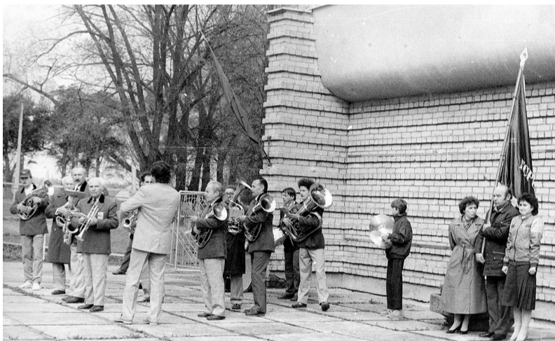
Līvānu kultūras nama atklāšana 1974. gadā