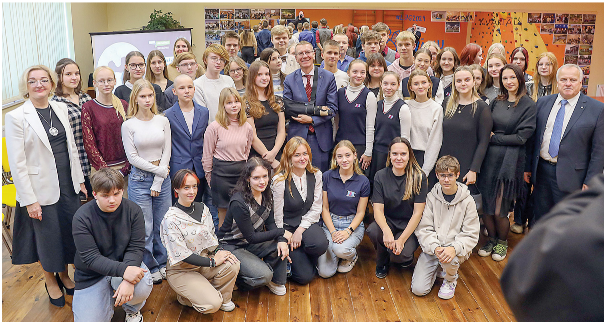
Valsts prezidents apmeklējot MJIC „Kvartāls”, kur tikās ar novada jauniešiem

resursiem jauniešu iniciatīvām. Šeit jauniešiem ļauj pašiem darīt un iesaistīties, lai dzīve novadā būtu interesantāka un pilnvērtīgāka,” norādīja Valsts prezidents E. Rinkēvičs.