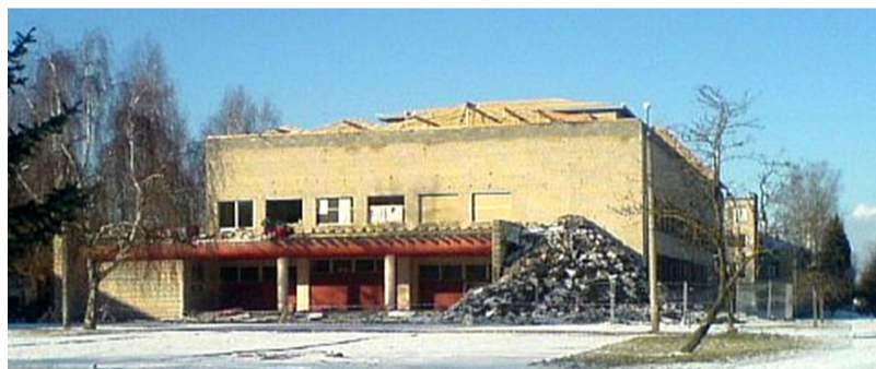
Kultūras centra ēkas rekonstrukcija 2007. gadā

2007. gadā Valsts investīciju programmas projekta ietvaros tika sagatavots kultūras centra tehniskais projekts, lai uzsāktu ēkas rekonstrukcijas 1. kārtu - veiktu jumta remontu. Lai rekonstrukciju pabeigtu, projektā piešķirtie līdzekļi bija nepietiekami, un ēkas atjaunošanas darbi apstājās. Tomēr Līvānu nova-