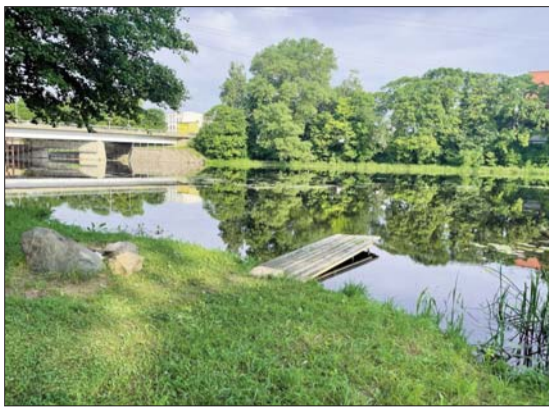
Iedzīvotāju balsojumā lielāko atbalstu guvušā projekta „Sveiks, Veiks!” īstenošanas vieta

3. Iedzīvotāju iniciatīvas grupas „Mēs varam” projekts „Sutru pagasta Šultu kapsētas vārtu renovācija” (pieprasītais finansējums 1000 EUR - Sutru pagasta Šultu kapsētas vārtu renovācija (vecās ķieģeļu vārtu arkas atjaunošana, krāsas