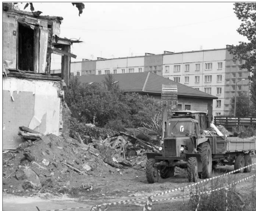
В сентябре ООО „Līvānu meliorators” провело работы по сносу здания, вывезло строительные отходы, насыпало слой чернозема. Со сносом связанные расходы дума надеется взыскать с владельца участка земли на улице Ригас 22.

И наконец на заседании 26 марта 2008 года дума Ливанского края приняла решение о принудительном сносе недвижимости на улице Ригас 22, если владелец в течении месяца не займется своей собственностью. 3 часть 31 статьи закона О строительстве предусматривает, „если владелец постройки до определенного времени не выполнил решение самоуправления, самоуправление организует приведение в порядок или снос этой постройки. С этим связанные расходы покрывает владелец постройки”.