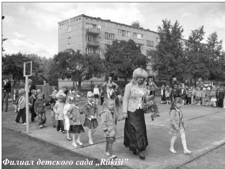
Филиал детского сада „Rūķīši”

26 августа депутаты и специалисты думы Ливанского края посетили учебные учреждения Ливанского края, чтобы узнать о произошедших в летний период изменениях, внедренные новшества и убедиться готовности образовательных учреждений к новому учебному году.