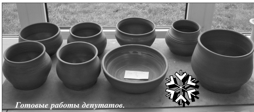
Готовые работы депутатов.

стников выдвинула социальная служба думы Ливанского края).