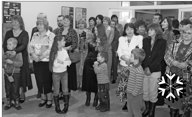
Гости на юбилее Латгальского центра искусства и ремесленничества

- в 2008 году проект в сотрудничестве с творческой рабочей группой «Дерево плодородия». В результате проекта у Латгальского центра искусства и ремесленничества было создано металлическое де-