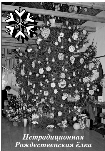
Нетрадиционная Рождественская ёлка

Латгальский центр искусства и ремесленничества за 5 лет существования показал себя как творческое и конкурентноспособное учреждение в Латгальском регионе, о чем свидетельствуют отзывы людей и статистика. С 2003 года число посетителей Центра увеличилось в двое: в 2004 году было зарегистрировано 4 300 посетителей, в свою очередь, в 2007 году уже более чем 9 343. До декабря этого года Латгальский центр искусства и ремесленничества всего посетили 34 527 гостей из Латвии, и из за рубежа.