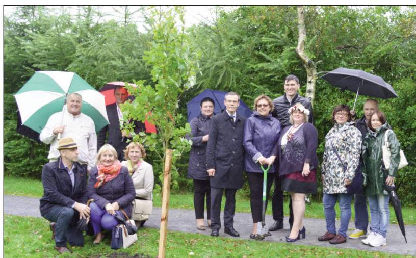
■ Iestādītais ozoliņš – simbols Latvijas un Īrijas draudzībai

no Latvijas kopā ar Mayo grāfistes pārstāvjiem vietējā skvērā iestādīja draudzības koku – ozolu.