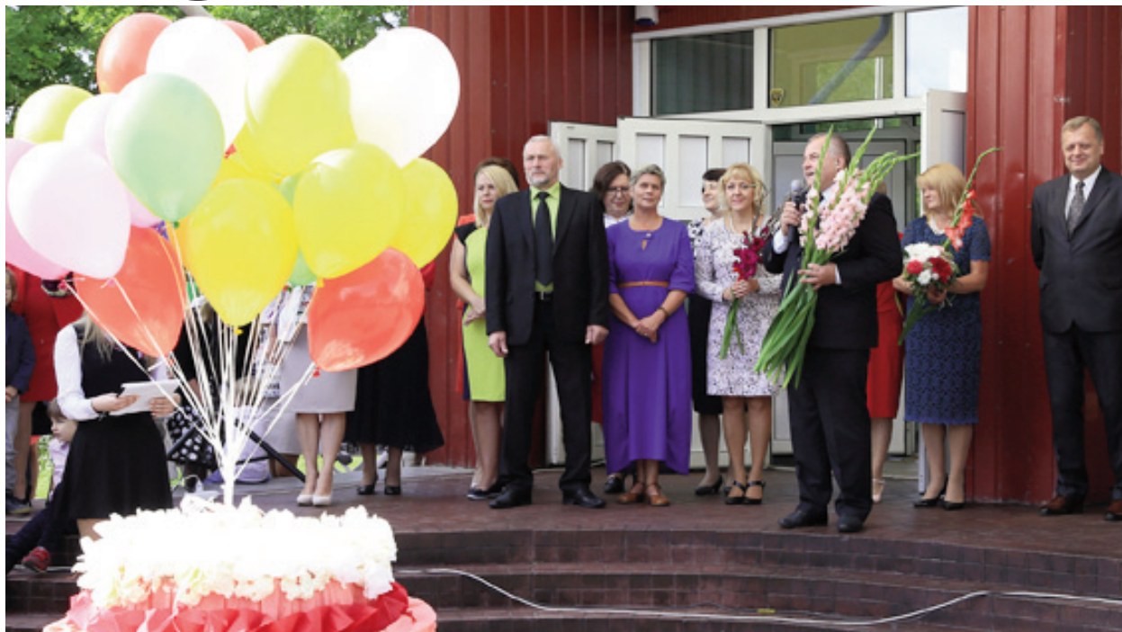
■ Zinību dienas pasākums pie Līvānu 1.vidusskolas

Profesionālās ievirzes izglītības iestādēs pabeidza 50 audzēkņi - J.Graubiņa Līvānu Mūzikas un mākslas skolā mūzikas nodaļu pabeidza 13, bet mākslas nodaļu 16 audzēkņi, Līvānu Bērnu un jaunatnes sporta skolā bija 21 absolvents.