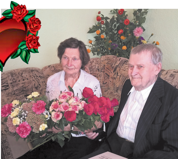
■ Laimīgā laulībā nodzīvoti 60 gadi

Dimanta jubilāru lielākais prieks dzīvē un lielākā bagātība ir viņu tuvie un mīlie cilvēki - bērni, mazbērni, mazmazbērni, kuru fotogrāfijas vienmēr turētas goda vietā. Līvānu novada dome un Turku pagasta pārvalde sirsnīgi sveic laulātos šajā skaistajā jubilejā un novēl daudz spēka, veselības un vēl daudzus laimīgus gadus savu tuvinieku vidū!