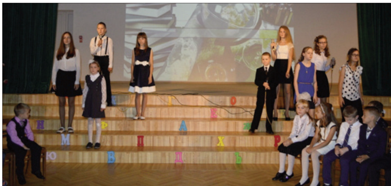
■ Zinību dienas pasākums Līvānu 2.vidusskolā - uzstājas skolas vokālais ansamblis

Noslēdzot 2015./2016. mācību gadu Līvānu novadā vispārējās izglītības iestādēs pabeidza 184 absolventi, no tiem pamatizglītību ieguva 106, bet vispārējo vidējo izglītību - 78 skolēni. Līvānu novada vidusskolu absolventu rezultāti obligātajos centralizētajos eksāmenos latviešu valodā, matemātikā, svešvalodās kopumā ir augstāki nekā vidēji valstī. Salīdzinot ar iepriekšējo gadu centralizēto eksāmenu rezultātiem, skolēnu zināšanu līmenis ir paaugstinājies angļu valodā un latviešu valodā, taču novadā rezultāti samazinājušies, tieši tāpat kā valstī kopumā, matemātikā, ķīmijā, arī bioloģijā.