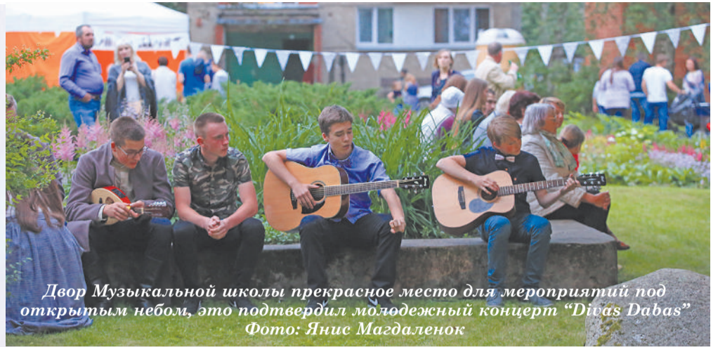
Двор Музыкальной школы прекрасное место для мероприятий под открытым небом, это подтвердил молодежный концерт „Divas Dabas”

Но самое большое СПАСИБО всем, кто посетил праздник, кто пришел, участвовал и оценил. До встречи в июле 2018 года!