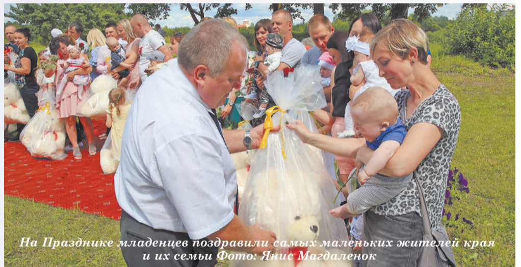
На Празднике младенцев поздравили самых маленьких жителей края и их семьи