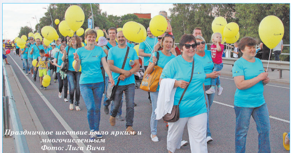
Праздничное шествие было ярким и многочисленным