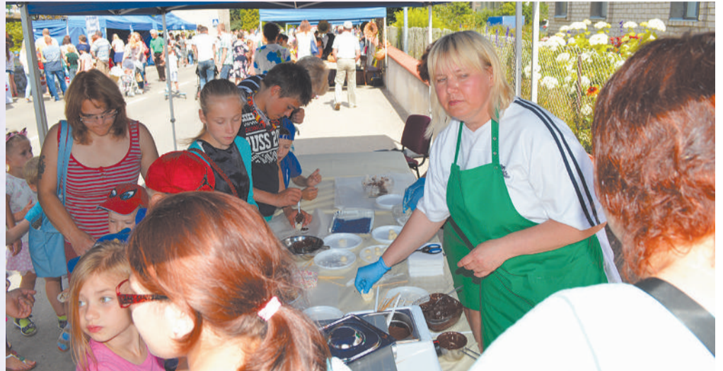
Улица Заля стала улицей для детей и юношей с различными аттракционами и творческими мастерскими