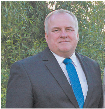
Андрис Вайводс, председатель думы Ливанского края