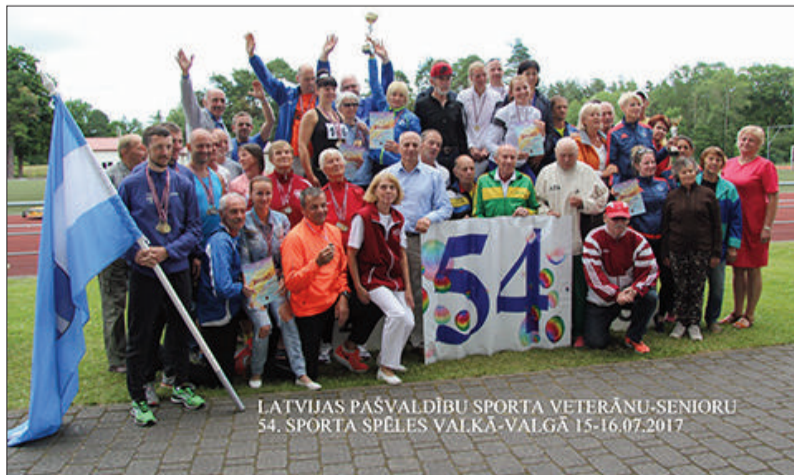
LATVIJAS PAŠVALDĪBU SPORTA VETERĀNU-SENIORU 54. SPORTA SPĒLES VALKA-VALGA 15-16.07.2017