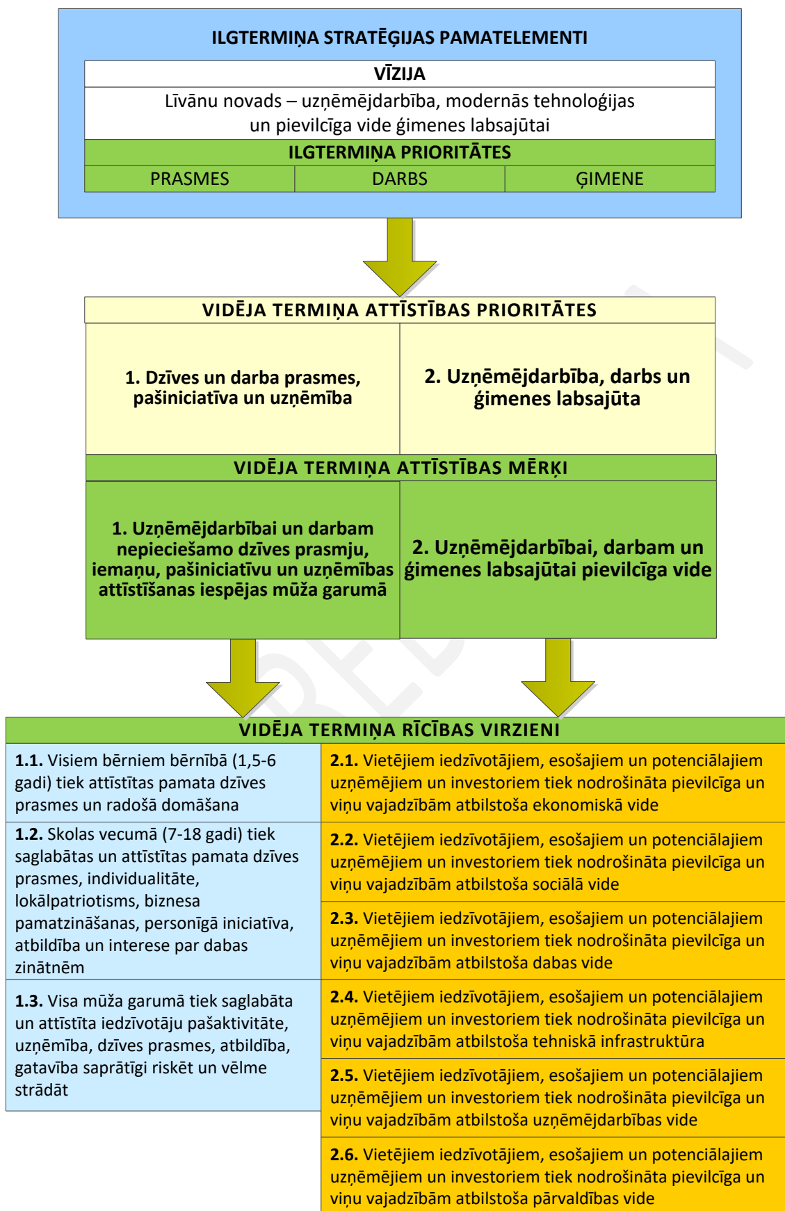
2.att. Vidēja termiņa attīstības stratēģijas pamatelementi un to saistība ar ilgtermiņa stratēģiju