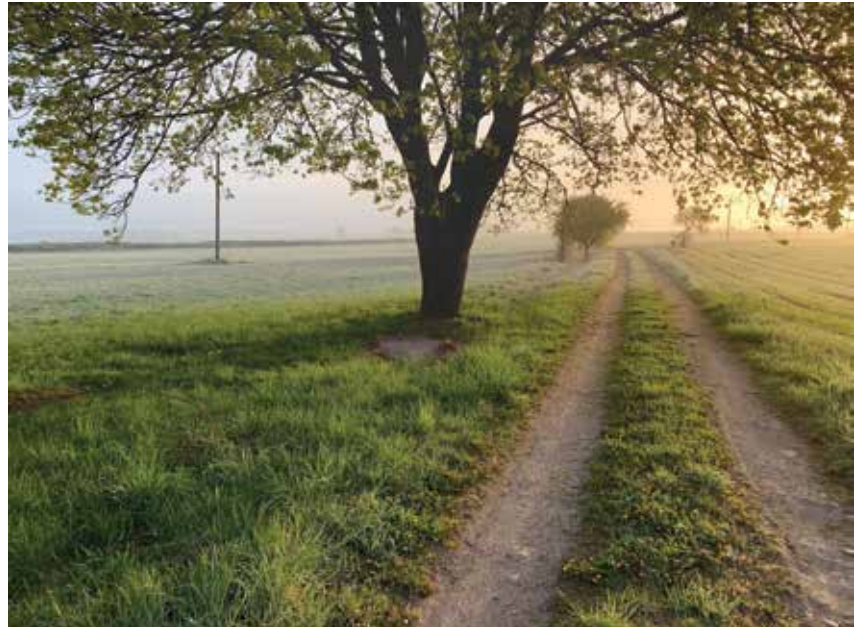
Lielie koki vainaga projekcijā spēj pasargāt citus augus no salnām

Zinu, ka lauksaimnieku vidū ir ļoti izplatīts viedoklis, ka klimatu mēs izmainīt nevaram, bet mikroklimatu gan. Mēs nevaram ietekmēt nokrišņus un to sadalījumu gada griezumā, bet mēs varam pārdomāt stratēģiju ūdens resursu izmantošanā. Mēs nevaram ietekmēt vēju un ātrumu, ar kādu tas pūš, bet varam cīnīties ar tā izraisītajām sekām. Mēs nevaram cīnīties ar temperatūras karstuma rekordiem, bet, prasmīgi mainot ūdens resursu izmantošanu un lauku veidošanas stratēģiju, viss ir iespējams. Salnu postošo ietekmi var mazināt, izmantojot jaunākos līdzekļus un mainot dārzu veidošanas principus. Līdzīgi var