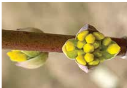
Bezsniega ziema un siltums sekmē priekšlaicīgu kizila ziedu plaukšanu