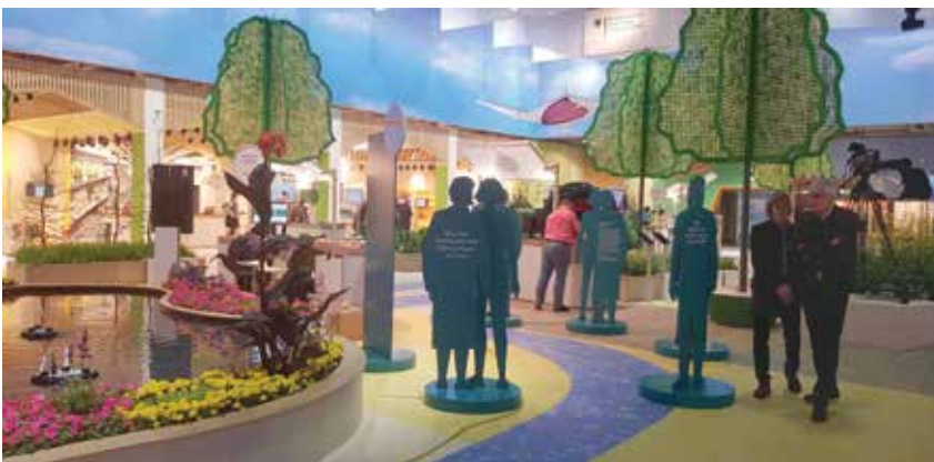
Vācijas Lauksaimniecības ministrijas standā - uzsvars uz pārtikas taupīgu lietošanu un videi draudzīgu saimniekošanu