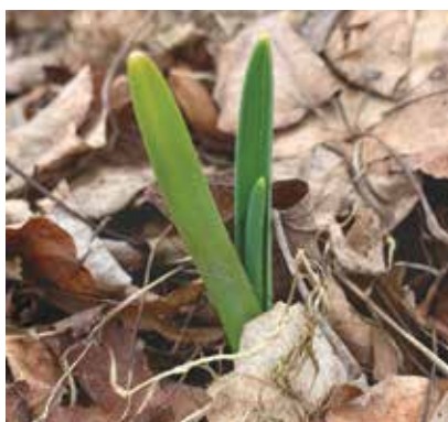
Mulča palīdz kultūraugiem pārdzīvot sausumu un karstuma periodus

tos un stādītos augus no postošā karstuma. Līdzīga aina veidojas arī salnu un sala gadījumā. Kurš no jums ir redzējis, ka dabiskos augšanas apstākļos kāds no augiem vienkārši nosalst. Salnu gadījumā lielākie koki droši pasargā no salnas visus tos augus, kas ir vainaga projekcijā. Sugu daudzveidībai un pareizam augu izvietojumam būs nozīmīga loma, domājot par lauksaimniecisko ražošanu jau pavisam drīz.