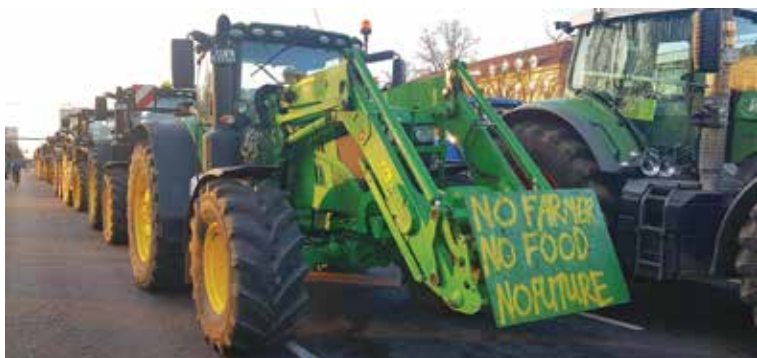
“Zaļās nedēļas” laikā Berlīnes ielās izbrauca Vācijas zemnieki, protestējot pret ierobežojumiem saimniekošanā